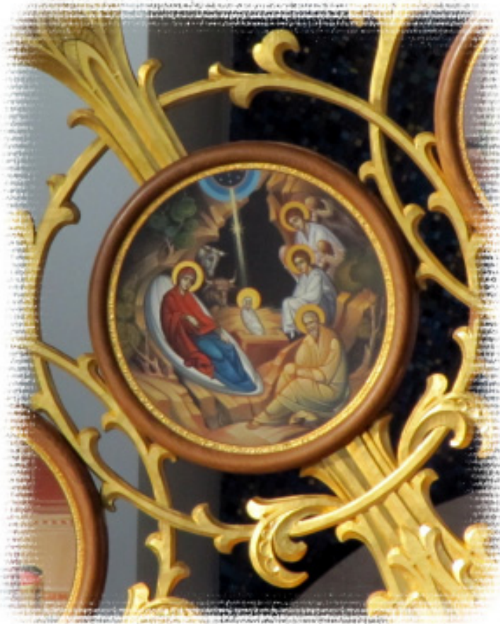
(Фото з іконостасу в Катедрі.)

видимим знаком любові Бога до нас. Печера, ясла, пелюшки - - все це ознаки, які підкреслюють величезну любов. І ангели співали: "Слава в